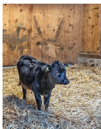
Der kleine Artgenosse der Rasse Dahomey schaut Elly hinterher.